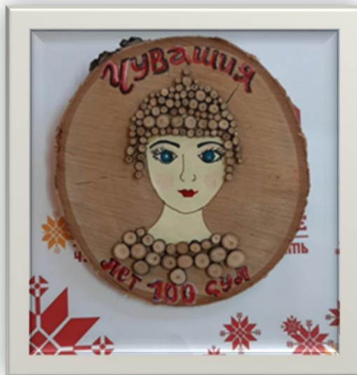
Рисунок 2 Аппликация из спилов