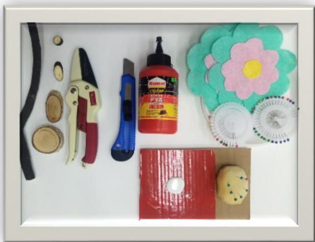
Рисунок 3 Материал и инструменты