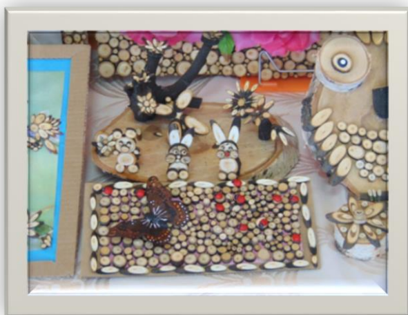
Рисунок 1 Спилопластика в работах дошкольников

Ручной труд способствует развитию у дошкольников мелкой моторики пальцев, создает условия для формирования связной речи и является предпосылкой становления навыков письма будущих школьников. Сухомлинский В. А. писал: «Истоки способностей и дарований детей – на кончиках их пальцев. От пальцев, образно говоря, идут тончайшие ручейки, которые питают источник творческой мысли».