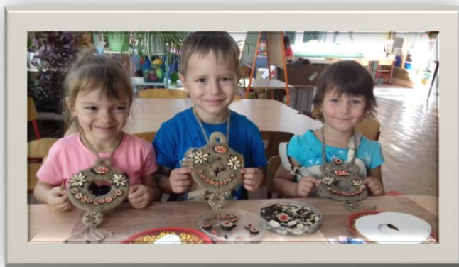
Рисунок 5 Мастерская ручной умелости «Спилопластика»

Актуальность данной практики определяется возможностью эффективной